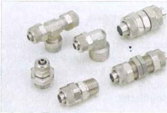
Raccord a coiffe