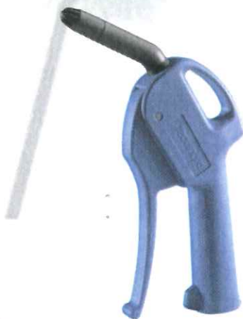
Soufflette à buse silencieuse